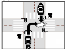
④⑤とも両信号で進入した場合